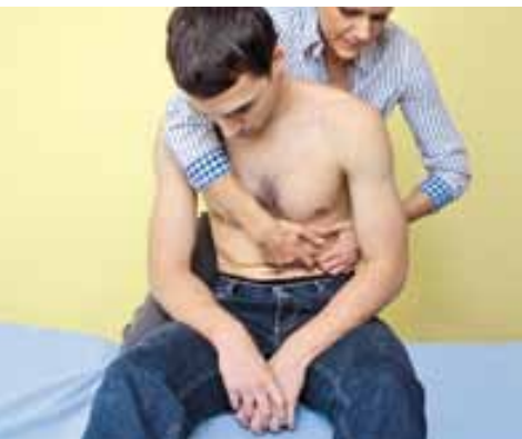
Technika pri pálení záhy a refluxovej chorobe žalúdka.