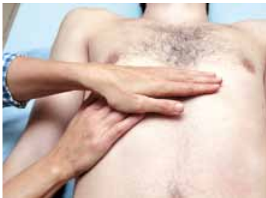
Vyšetrenie pečene hmatom, či nie je blokovaný jej pohyb a s tým súvisiaca správna funkčnosť.