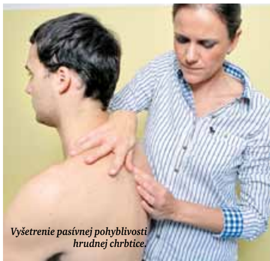
Vyšetrenie pasívnej pohyblivosti hrudnej chrbtice.

Jedno osteopatické ošetrenie trvá dvadsaťpäť minút až hodinu, podľa toho, či ste nový pacient, alebo nie, aké máte ťažkosti a akú liečbu potrebujete. Absolvujete ho v stoji, sede a najmä poležiaci. Musíte sa vyzliecť do spodnej bielizne. Ak ste na ošetrení prvý raz, osteopat sa vás spýta na rodinnú a osobnú anamnézu – na doterajšie ochorenia, operácie, úrazy, zubárske zásahy, prežitie psychotrauma, alergie, životosprávu. Pomôže, ak máte so sebou výsledky vyšetrení. Rozhovor o anamnéze je veľmi dôležitý na pracovnú diagnózu a voľbu liečebných techník.